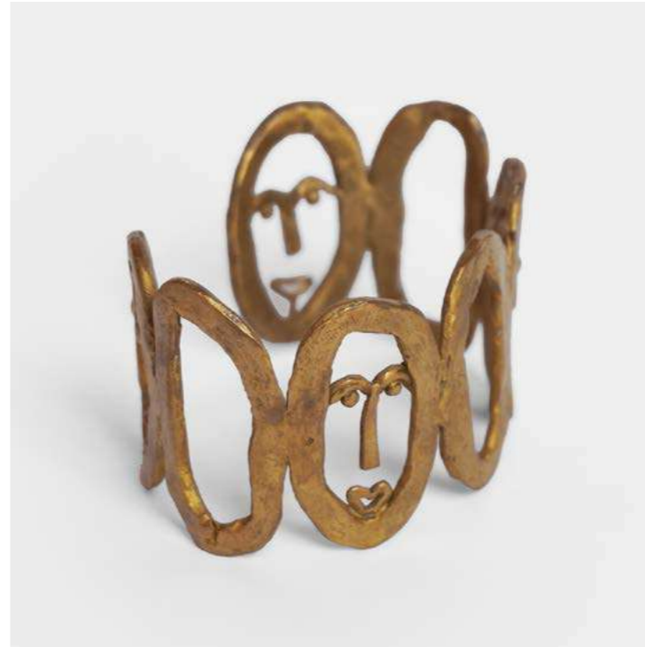
BRACELET LA RONDE Michelle Crouzet - 2025 - H 4,2 L 7,2 P 5 cm Bronze doré