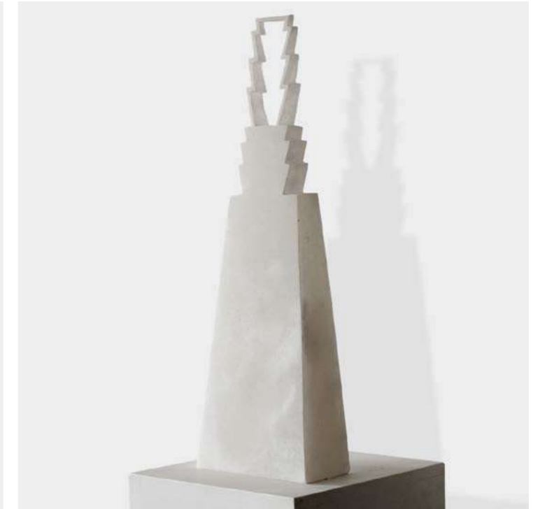
BAAL F.X. Poulaillon - 2025 - H 60,5 L 20 P 10 cm Albâtre