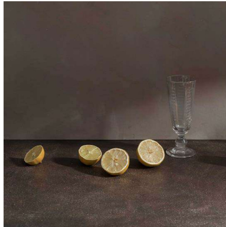
QUATRE CITRONS ET VERRE 1/6 Thierry Genay - 2025 - H 30 L 30 cm Tirage fine art sur papier photo mat, cadre bois noir.