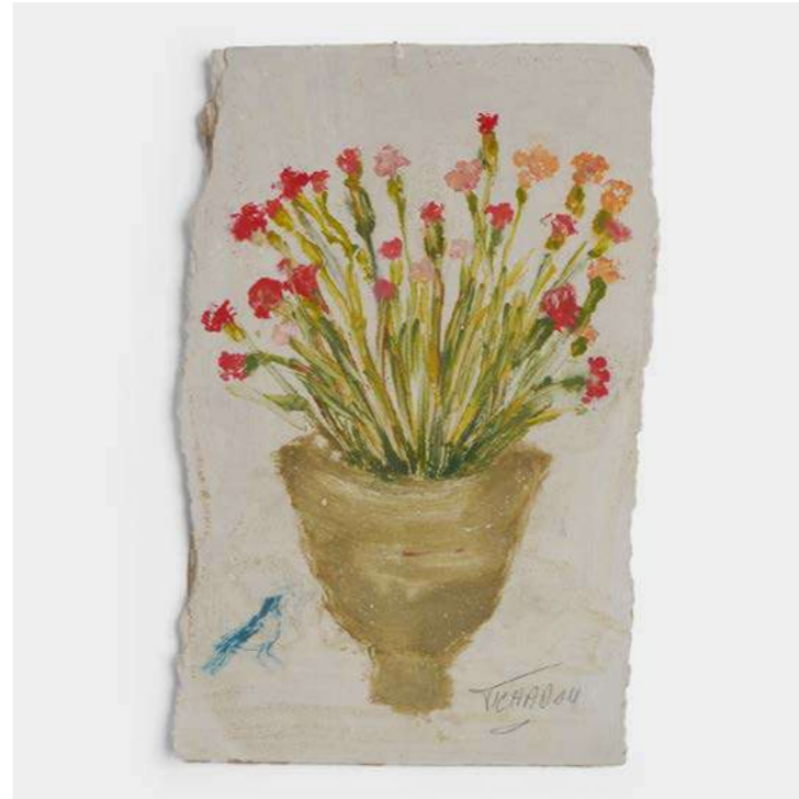
LE BAISER DU MATIN (FLEURS ET OISEAU) Corinne Tichadou - 2025 - H 30,5 L 19,5 P 1,3 cm Huile, acrylique et pastels sur plaque de plâtre