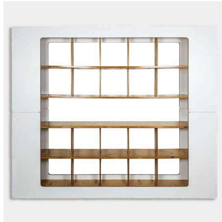
BIBLIOTHÈQUE EN PIN ET MÉLAMINÉ STILWOOD Roberto Pamio, Italie - 1972 - H 180 L 214 P 34 cm Bois blond et mélaminé blanc

Ses premières années dans la profession sont entourées de marchands avec lesquels elle fréquente assidûment les salles de vente. Archives, expositions et livres d'art aiguisent sa curiosité et forgent déjà son goût pour le design du XXe siècle.