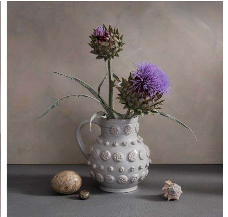
CARDUUS, OEUF, PYRITE ET COQUILLAGE 1/6 Thierry Genay - 2025 - H 30 L 30 cm Tirage fine art sur papier photo mat, cadre bois noir.