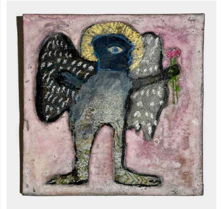
L'ANGE OISEAU Corinne Tichadou - 2025 - H 25 L 25 P 2 cm Huile et pastels sur papier marouffé sur bois