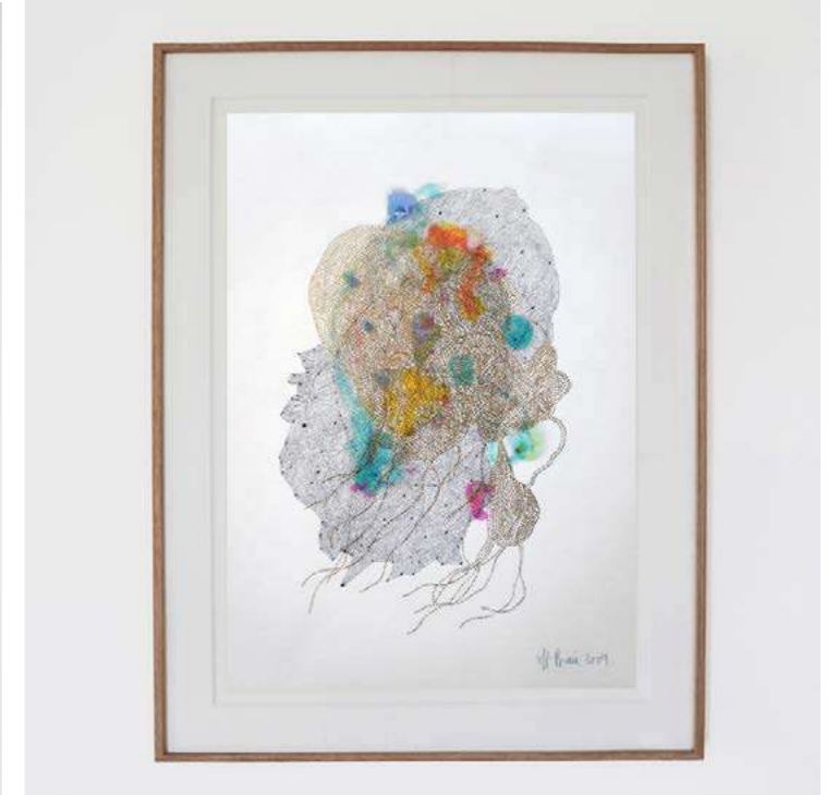
SANS TITRE 29,7 x 21 Marie-Pierre Biau - 2019 - H 44 L 35 P 3 cm Encres et feutres sur papier