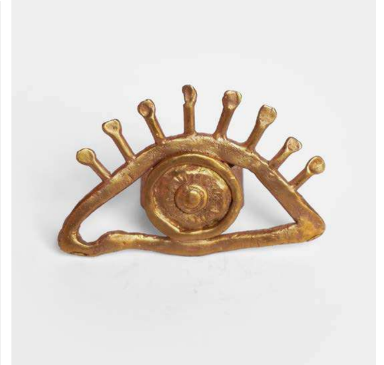
BAGUE L'ŒIL Michelle Crouzet - 2025 - H 3,5 L 5,3 P 2 cm Bronze doré