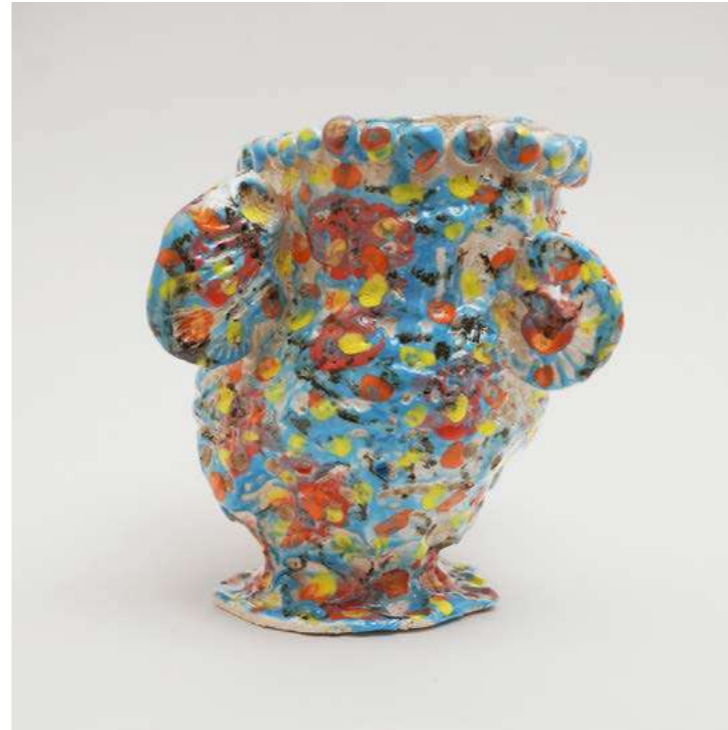
VASE COUILLE 7 MULTICOLORE GRES BLANC M Marie-Pierre Biau - 2025 - H 16,5 Ø 18 cm Grés émaillé à décor d'engobes et d'oxydes