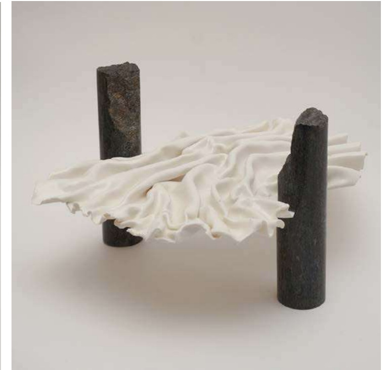
OCEANINE D.Stanczel & T. Scaciga - 2019 - H 25 L 34 D P 40 cm Porcelaine et granit Eclisseo noir argenté