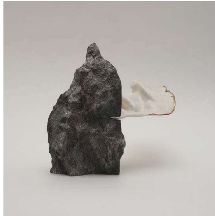
PICCOLO IMAGO III D.Stanczel & T. Scaciga - 2025 - H 15 L 24 P 10 cm Porcelaine, feuille d'or et granit Eclisseo noir argenté