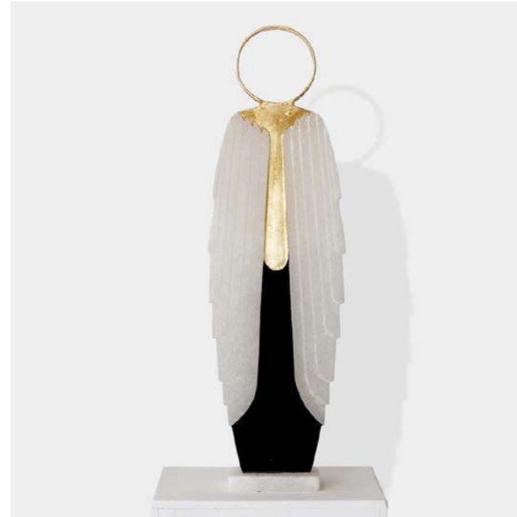
EN NOUS LE PHENIX F.X. Poulaillon - 2025 - H 62 L 18,5 P 10 cm Albâtre, encre et feuille d'or