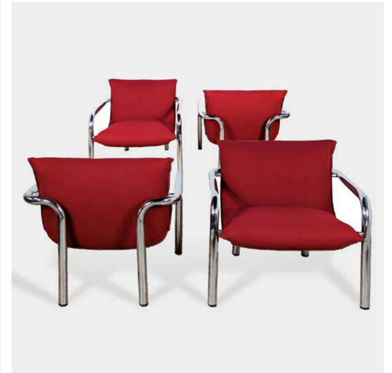
4 FAUTEUILS ITALIENS CHROME ET TISSU ROUGE Non signés, Italie - 1970 - H 70 L 70 P 73 cm Albâtre