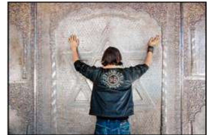
TEMPLE HINDOU, HIMALAYA (10/21) 2011 - H 93 L 140 cm Tirage pigmentaire sur papier baryté et dibond