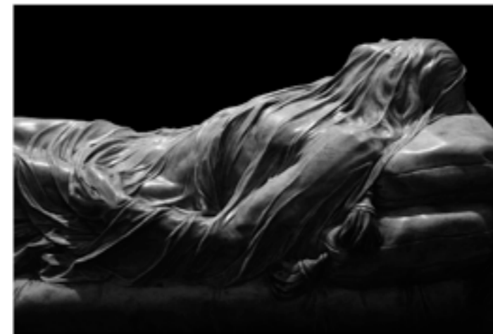
CRISTO VELATO, SANSEVERO, NAPLES 1/12 1994 - H 100 L 140 cm Tirage pigmentaire sur papier baryté et dibond