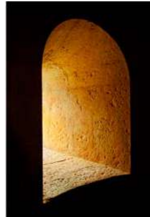
ABBAYE DU THORONET, FRANCE (1/12) 2012 - H 110 L 75 cm Tirage couleur papier fine art perlé sur dibond