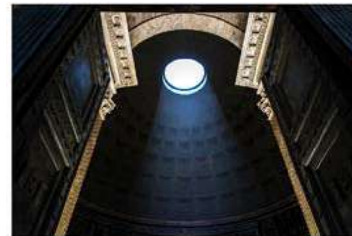
PANTHEON, ROME, ITALIE (1/12) 2020 - H 93 L 140 cm Tirage couleur papier Hahnemühle Baryta perlé sur dibond