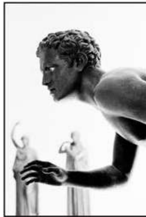
BRONZE D'HERCULANUM, NAPLES (12/21) 1992 - H 90 L 60 cm Tirage pigmentaire sur papier baryté et dibond