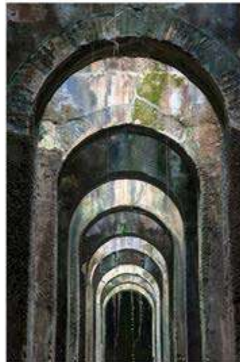
PISCINA MIRABILIS, CAP MISÈNE, ITALIE 2010 - H 140 L 93 cm Tirage couleur papier Hahnemühle Baryta perlé sur dibond