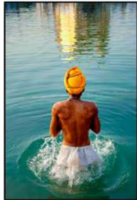
TEMPLE D'OR D'AMRITSAR, INDE (2/12) 2011 - H 90 L 60 cm Tirage pigmentaire sur papier baryté et dibond